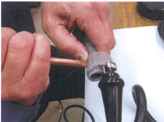
網同志の溶接下側の網を挟む